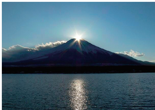
山中湖からのダイヤモンド富士

富士五湖地域は、富士山の噴火で流出し溶岩流が川をせき止めて誕生したと言われる山中湖、河口湖、西湖、精進湖、本栖湖の5つの湖や、富士山の雪解けが湧き出した忍野八海と言われる8つの池など、富士の裾野に広がる富士箱根伊豆国立公園があり、平成25年6月には富士山が世界文化遺産に登録され、豊かな大自然と風光明媚な富士山を有した国際観光地域として栄えております。