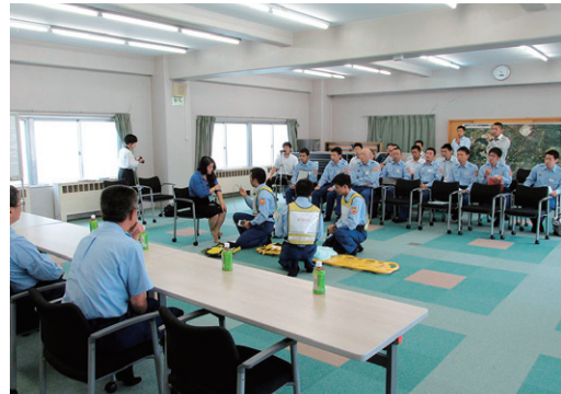
英会話講習会の査閲風景

さらにiPadを救急車に配備し、翻訳アプリを使用してコミュニケーションを図るなど、現在では、救急外国語マニュアルやiPadを活用し、あらゆる視点により多言語対応にあたっております。